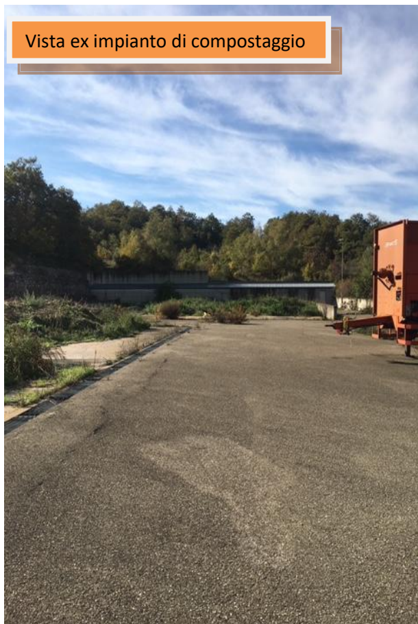
Vista ex impianto di compostaggio