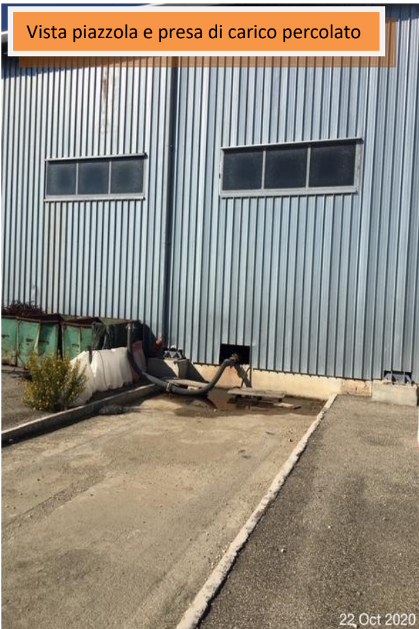
Vista piazzola e presa di carico percolato