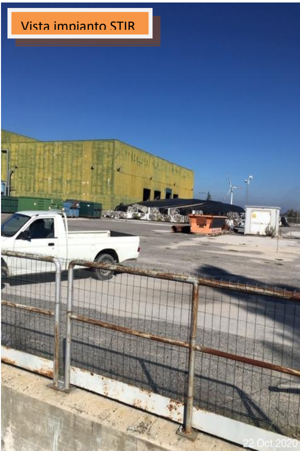
Vista impianto STIR