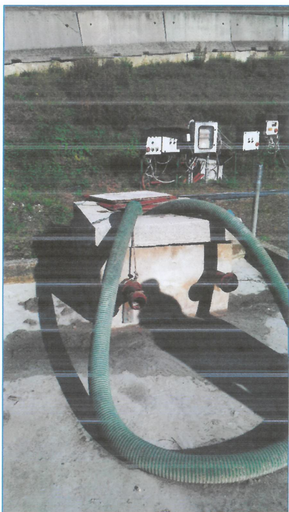
Foto n.1, n.2 - VASCA STOCCAGGIO PERCOLATO