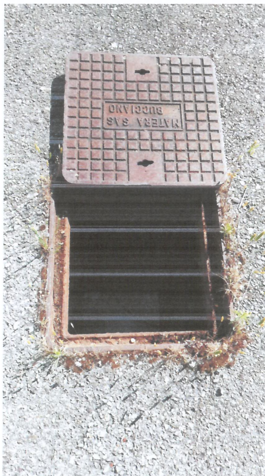
Foto n. 1 e n 2 - Pozzetto raccolta percolato