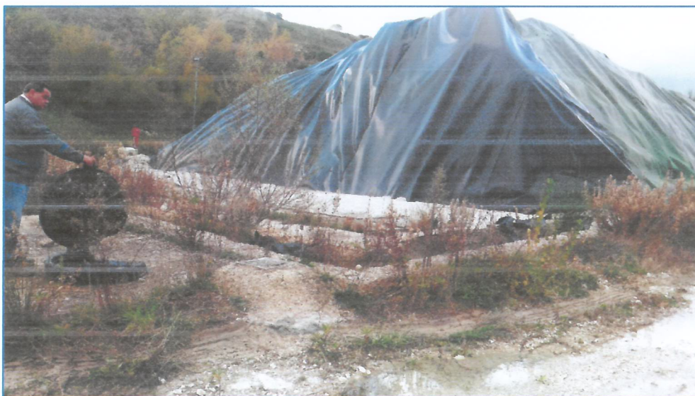
Foto n.1, n.2, n.3 - POZZETTI RAPPRESENTATIVI A SERVIZIO PIAZZOLE A-B-C