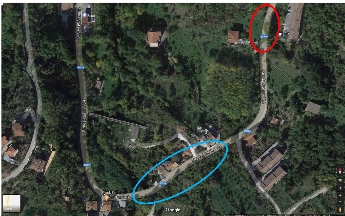
Stralcio ortofoto Comune di Pannarano (BN)

L'area oggetto di intervento è situata nel Comune di Pannarano (BN) lungo la S.P. n. 43 "EX SS. 374 – DI SUMMONTE E DI MONTEVERGINE" dove nella stessa area di influenza si è verificato un cedimento della sede stradale, all'altezza dell'insediamento delle case popolari (a monte) e della proprietà Pagnozzi (a valle), e un distacco di muri di contenimento del terreno di pertinenza, in prossimità del contesto abitato.