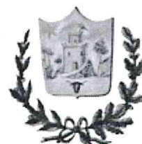
COMUNE DI REINO