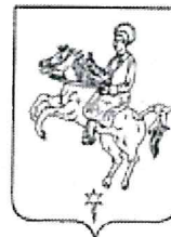
COMUNE DI FRAGNETO L'ABATE