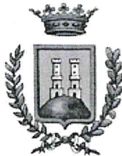
COMUNE DI COLLE SANNITA