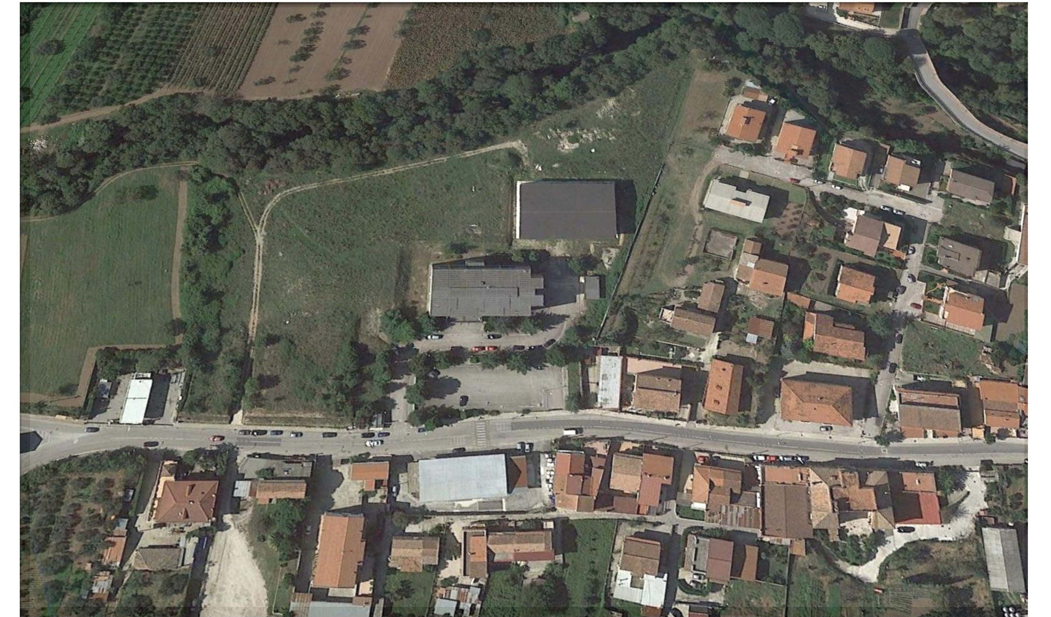
stato dei luoghi da foto aerea