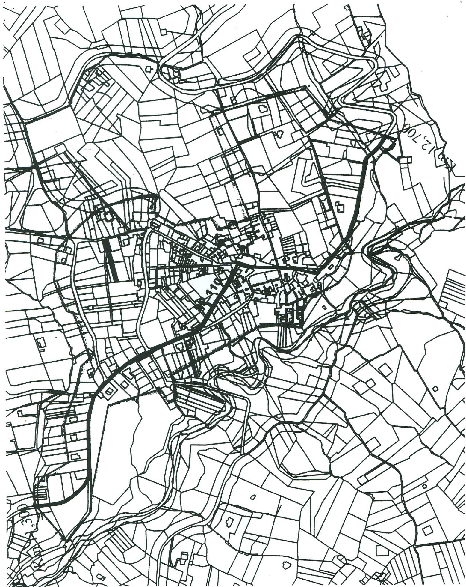
AGGIORNAMENTO DELIMITAZIONE CENTRO ABITATO "CAPOLUOGO"