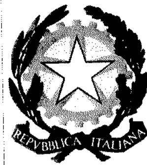
Ministero della Giustizia