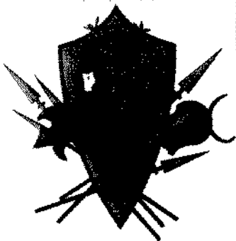
Provincia di Benevento