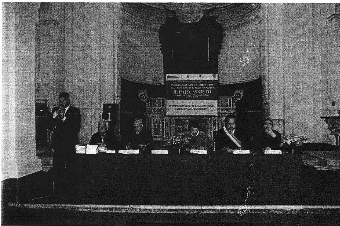
22 maggio 2010 – chiesa di S.Francesco – Apertura delle manifestazioni

Questa nostra piccola cellula culturale, benchè ancora in realtà embrionale in quanto creata dalla Pro Loco solo nel 2005, vuole fin d'ora, però, ribadire l'impegno a continuare con il progetto annuale " SULLE TRACCE DI SISTO V " e, soprattutto, intensificare lo sforzo per avvicinare le giovani generazioni al grande patrimonio storico - culturale che distingue questo territorio. Perché questo avvenga, faremo in modo che le porte della biblioteca siano sempre aperte e, per tutti gli interessati, siano sempre fruibili e disponibili i documenti delle nostre librerie per studiare e conoscere il passato. In questo modo, se non altro, si può tentare di onorare la storia e contribuire, anche modestamente, alla crescita sociale del proprio territorio.